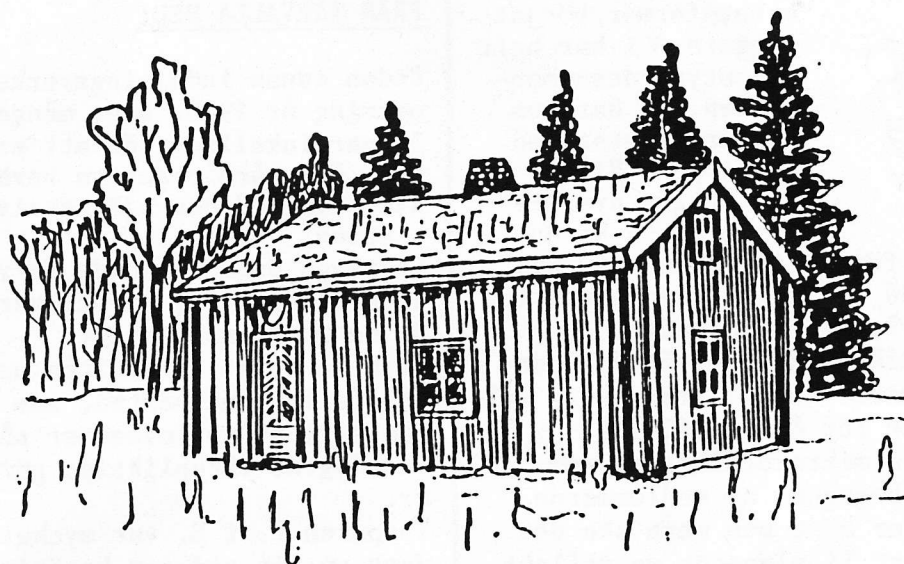
Soldattorpet No 550 - Vagnhult